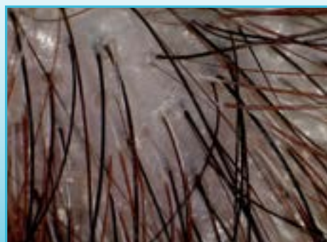
Αποτέλεσμα μικροσκοπικού τριχολογικού ελέγχου πριν τη θεραπεία (αριστερά) & 5 μήνες μετά τη θεραπεία PRP (δεξιά). Hairline (Μετωπιαία Γραμμή)